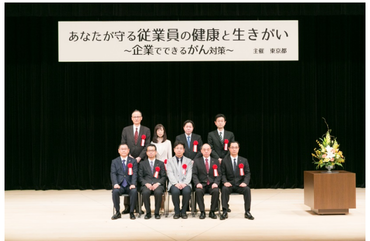
「優良賞」「奨励賞」受賞者